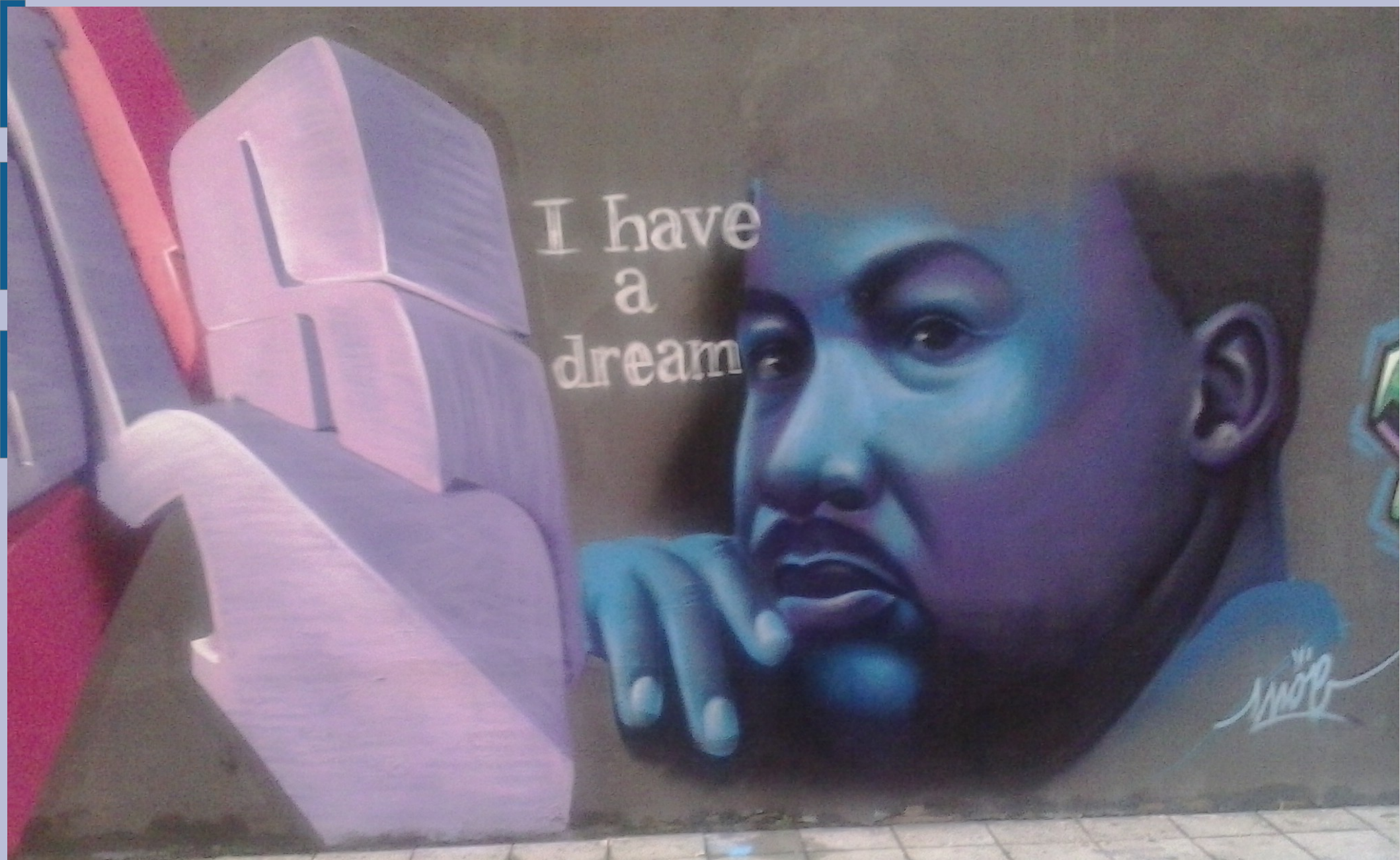
Pintada n´ el barriu "Laviada", Xixón, 2 / 10 / 2013