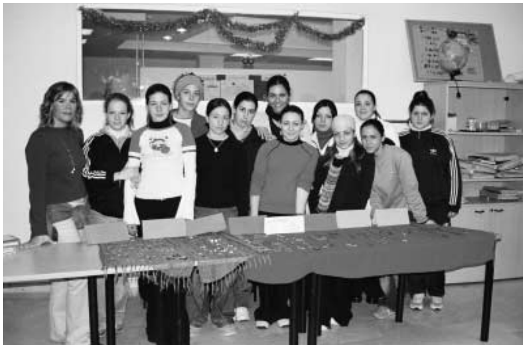
Programa de Garantia Social

Se articula en torno a tres servicios básicos: